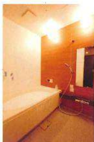
バスルームはカレン天神本店・博多店・福岡東店に。(他店舗はモールやビルの規約上、作れなかったそう)

個室へ移動し、着替えを済ませたら1で選んだバスオイル入りの泡風呂へ♡。①香りにのせてハ