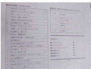
問診表の幾つかの質問だけでも、その日の心身状態が分かる。

今から体験する「ポールシェリー」について説明をうけた後、問診表の記入。その後、バスオイルサンプル6種類の中から、直感で1つを選ぶ。