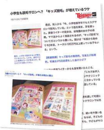
▲Yahoo! トピックスに掲載されました!

素直な思いであり率直な意見でした。今回の特集も、恐ろしく局内での、かなり厳しい考察がなされた上なのだと思えますが、テレビです