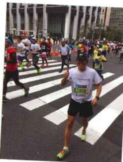
▲肉離れて、何とか歩いています

あなたが貸してくれた栄養ドリンクやゼリーを持った方が渡してくれた。コーラをくれたお婆ちゃんもいました。これら皆、休憩所のスタッフではなく、一般の方々。その装備・対応に東京マラソンの凄さを感じました。 東京マラソンのキャッチコピー「東京がひとつになる日」。皆で応援する。皆がひとつになる。身に染みて感じ、東京の人、日本人の優しさに改めて感動。それをエネルギーに変え、「何があっても絶対完走する!!」と何とか4時間38分でゴールを切りました。