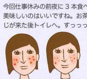
長年顔に居座っていたデカ赤ニキビ。排便と共に赤みが引き、小さくなって来ました！体重も-1.7kg減!!

学生時から便秘。やっと出たとしても常に下腹部に残っている感があって、薬に頼る以外すっきり出た事なんてありません。もうそれが当たり前になっていました。いつも頼りに大きな赤ニキビが出来て、便秘の影響だと思いがちなす術もなく。以前便秘に効くお茶も飲んだ事があるのですが、普段水分を摂らない方なので量を飲み続けるのが結構しんどくて、飲む回数を減らすとめっちゃ濃くして飲んだらトイレから出られなくなって大変でした。以来絶対出したい時は休みの前日に便秘薬です。