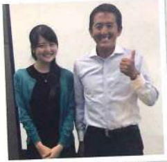
その日の様子、皆様はご覧になりましたか?

去る6月19日、ハイパースキンカレン(以下HSK)でエステサロンでのフランチャイズを展開しているデイトナーさんの120名を超えるオーナー様が集う、「上がる竹セミナー」が東京・品川にて開催されました。北は北海道から南は沖縄迄、全国からお集りになられたタイトル通り