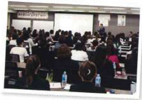
気持ちは意識・目標・売上げ全てが「上がる」素晴らしいセミナーに、私共も開発者として講演依頼を頂き、約1時間程お話をさせて頂きました。

私も考案、開発者として講演依頼を頂き、約1時間程お話をさせて頂きました。参加されたオーナー様達の熱気を直に感じ、私もとても良い刺激を頂けた貴重な時間となりました。