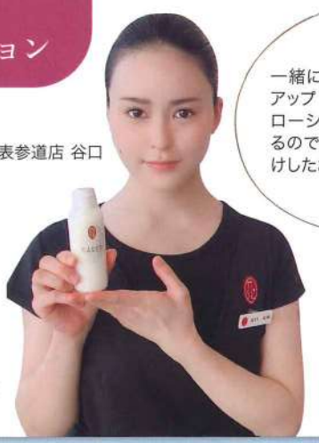
東京 表参道店 谷口