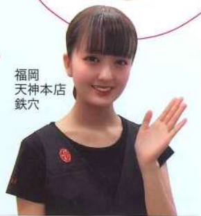
福岡 天神本店 鉄穴

カレンファクター 30ml 7,560円 紫外線A波B波もブロック!フラレン配合で抗酸化作用の優れた美容液兼化粧下地です。