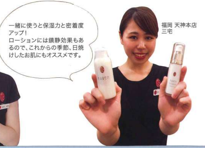
福岡 天神本店 三宅

一緒に使うと保湿力と密着度アップ! ローションには鎮静効果もあるので、これからの季節、日焼けしたお肌にもオススメです。