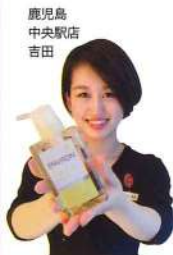
鹿児島 中央駅店 吉田

ラポリス ボディシャンプー 400ml 1,728円 / 詰替用 1,404円 家族みんなで使える、泡立ち良い爽やかな香りのジェルタイプ。全身洗浄料。