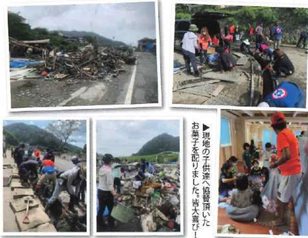
▶現地の子供達へ協賛頂いたお菓子を配りました皆大喜び！

7月の被災直後からFacebookで物資と現地での活動出来る球磨川災害復旧ボランティア参加の呼び掛けを開始、現地活動は9月6日で7回目を迎え、延べ388名もの方々にご協力頂きました。