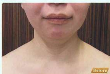
フェイスライン、首のシワ