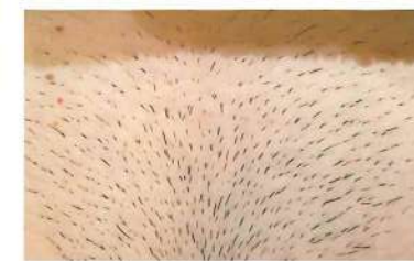
VIO脱毛 20回 40代