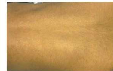
背中 6回 8歳