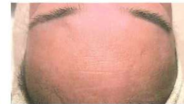
額 3回 40代