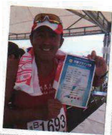
▲天草 / 完走出来て良かった!