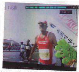
▲テレビに映っちゃってました