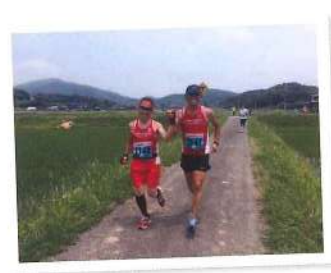
向津具(むかつく)マラソンでは、5月に患った尿管結石が競技中にまさかの再発! 激痛に耐え、仲間にも励まされてどうにか完走しましたが、この石にはまさにムカツキました(笑)

「もう止めたい」と何度も思う中、願っていた理想的目標を想定外に達成出来た事で「また次も頑張りたい」と思えました。