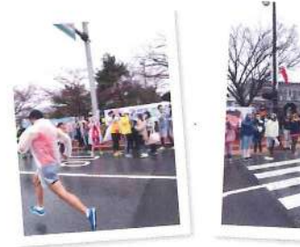
その後、1キロ手前迄1位でした笑

今回の挑戦で7回目となるフルマラソンは、初の国外「韓国・慶州」しかもひよひよい粉れ込み先頭から3列目！ というのも今回はお客様が韓国にいらしてあり、「写真を撮ってくれる」この事でしたので、「目立つ様