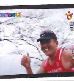
慶州桜マラソン大会の様子が放送されていました。福岡マラソン同様、エンディングロールでまたもや引っ掛かりました(笑)

「まさかのサブ4」実はサブ4(4時間以内で完走する事)は今年の一つの目標ではあったのですが、今回まさか自己ベストより24分も縮まるという、自分でも信じられない記録達成。